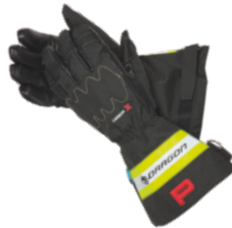
DRAGON 2.0 gemäß EN 659:2008