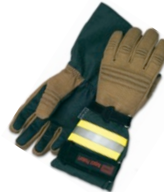
FIREDEVIL 911 X-TREME 2.0 gemäß EN 659:2008