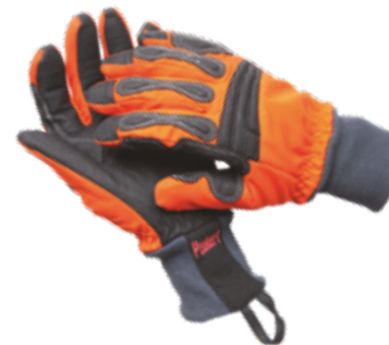
HERO gemäß EN 388:2003