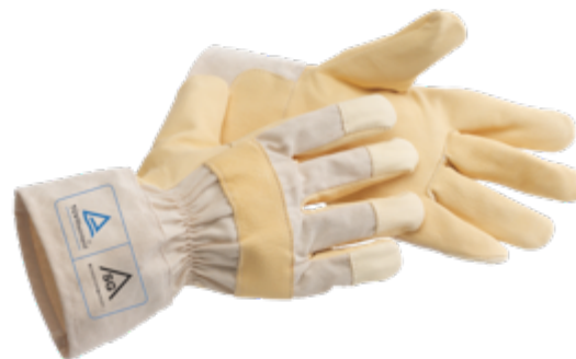
MEC WORK gemäß EN 388:2003