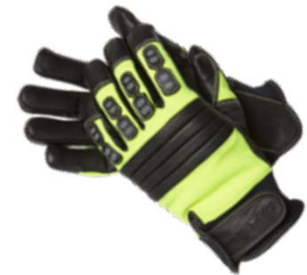
DEFENDER gemäß EN 388:2003