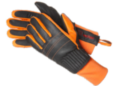
NEW DIMENSION 2.0 gemäß EN 659:2008