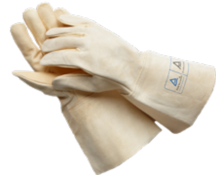
MEC WELDER gemäß EN 388:2003