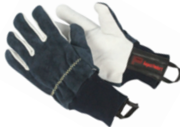
REBEL Strick gemäß EN 388:2003