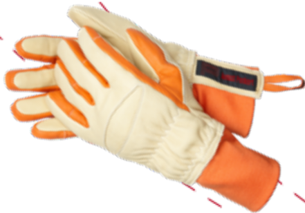
ELK DEFENDER 2.0 gemäß EN 659:2008