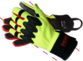
BAD BOY gemäß EN 388:2003