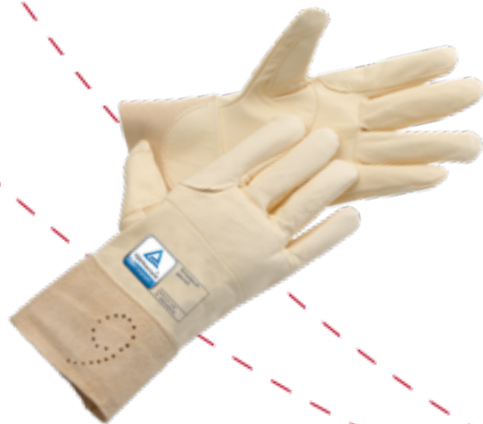
MEC HEALTH gemäß EN 388:2003